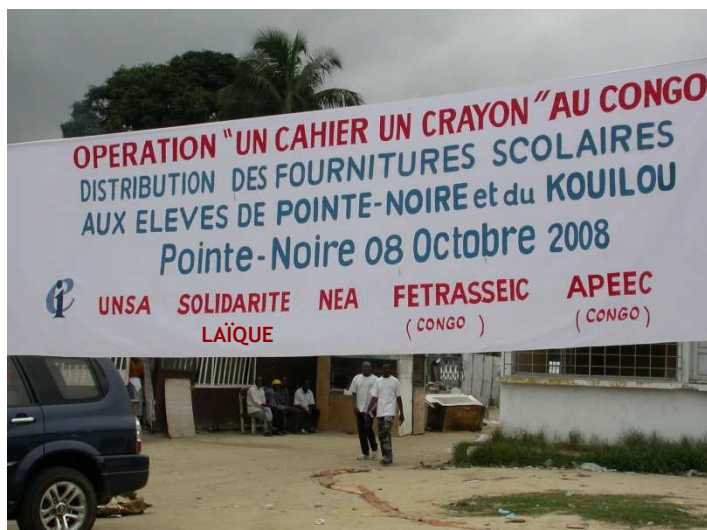
Manifestation à Pointe Noire (Bourse du Travail)

Grâce à la collaboration des différents acteurs de l'opération en France et au Congo, les fournitures scolaires ont été remises début octobre dans plusieurs écoles de deux départements de la République du Congo : le département de Pointe Noire et celui de Kouilou.