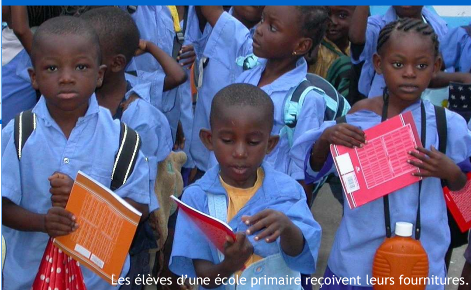
Les élèves d'une école primaire reçoivent leurs fournitures.

20 tonnes de fournitures scolaires collectées en France en 2007 ont été distribuées à plus de 16 000 élèves de la République du Congo.