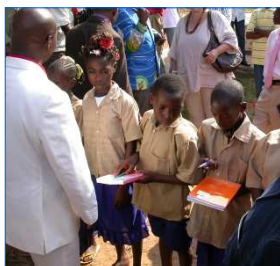
Rencontre avec le Secrétaire général de la préfecture Pointe Noire