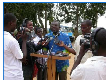
Discours du Vice-Président de l'APEEC

La presse locale était présente à la remise symbolique de la collecte faisant l'écho de l'action « Un cahier, un crayon ».