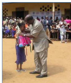
Le Président de la FAPE remet un lot de fournitures