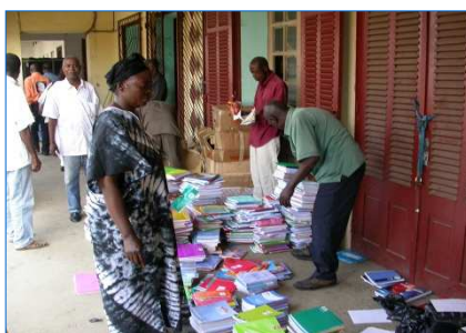
Les enseignants organisent la distribution