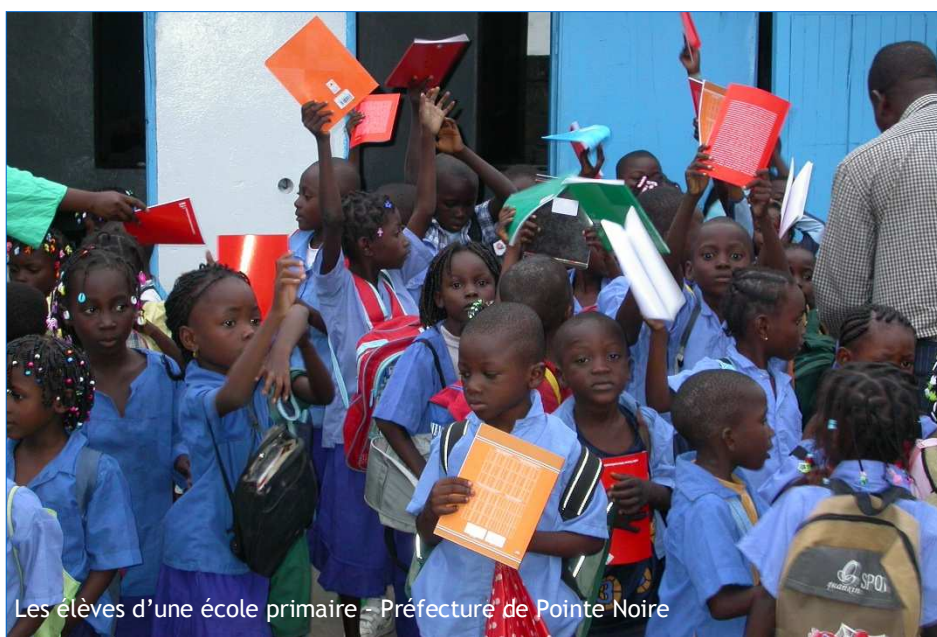
Les élèves d'une école primaire - Préfecture de Pointe Noire