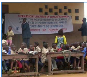
Une classe lors de la Cérémonie Préfecture de Kouilou