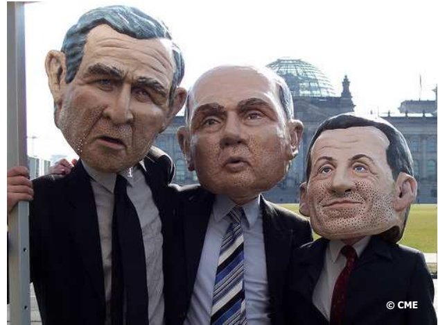
Les leaders du G8 en Allemagne pour « la plus grande leçon du monde »